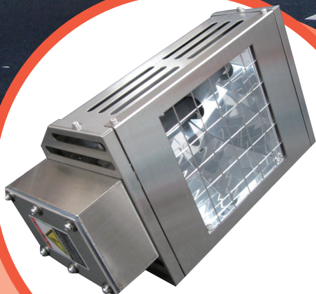
遠赤外線融雪装置 FSB-FIRO3